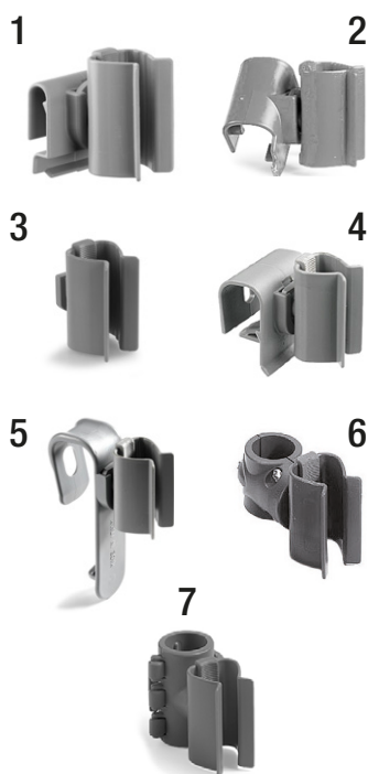
Gancho portamangos de plástico